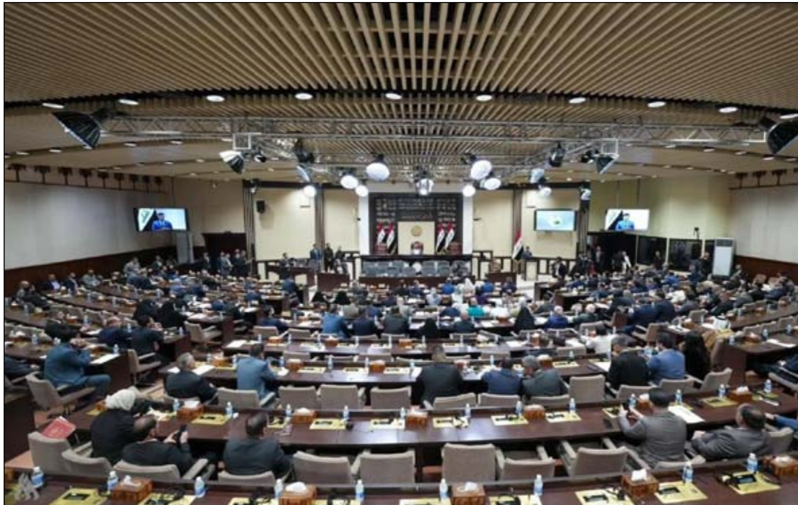
المراقب العراقي / أحمد سعدون