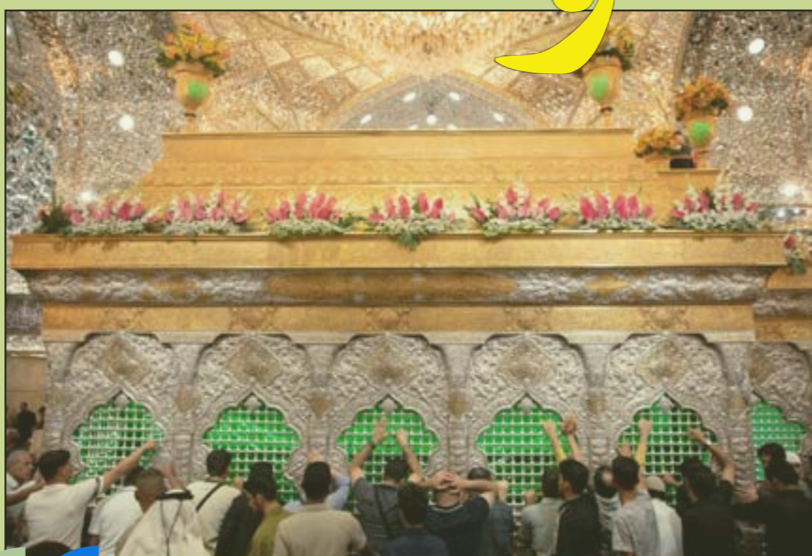
الورود تروي حكاية الفرح عند ضريح الإمام الحسين (عليه السلام) تزامناً مع عيد الغدير الأغر