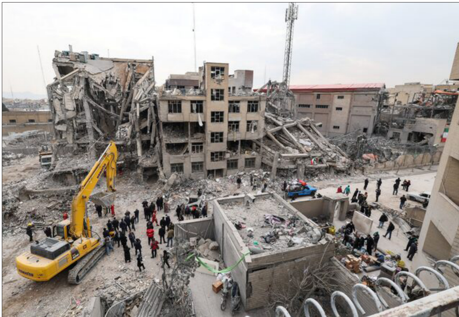
بقلم: حسني محلي