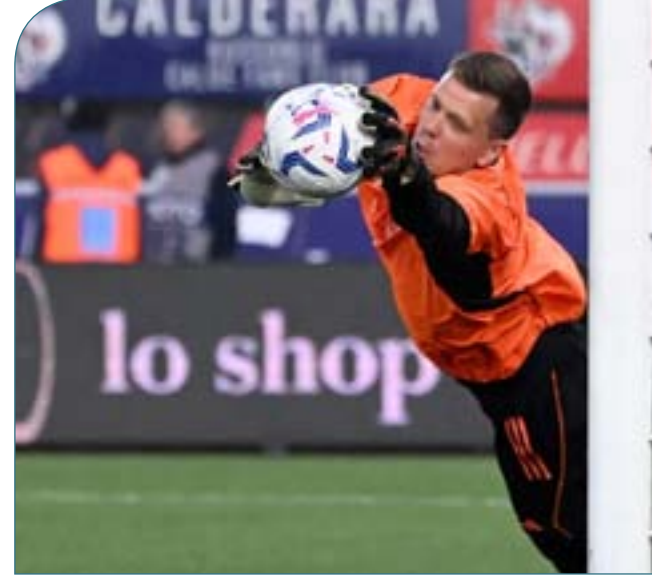
أندرياس كريستيانو رونالدو

فاننسيا في الجولة الختامية لليجا، في مباراة تحصيل حاصل لم تؤثر على تويج النادي الكاتالوني بلقب الدوري.