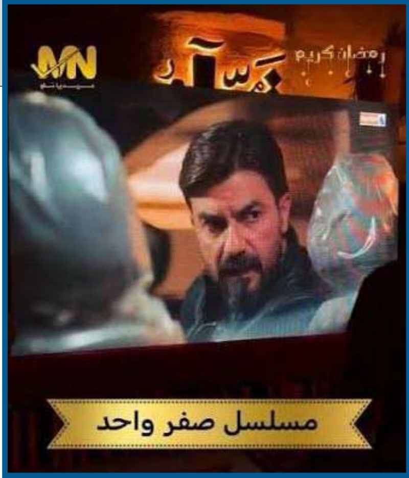
مسلسل صفر واحد