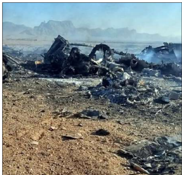
مقر خاتم الأنبياء:

نفذت المقاومة الإسلامية في لبنان مجموعة من العمليات العسكرية استهدفت تجمعات لآليات وجنود الاحتلال الإسرائيلي على الحدود، ومستوطناته في الأراضي الفلسطينية المحتلة. واستهدف مجاهدو المقاومة تجمعا لآليات وجنود «جيش» الاحتلال في موقع إبل القمح، وتجمعا آخر عند بوابة فاطمة على الحدود اللبنانية- الفلسطينية، بصليتين صاروخيتين. وفي إطار التحضير الذي وجهته المقاومة إلى عددٍ من مستوطنات شمال فلسطين المحتلة، استهدف المجاهدون مستوطنة نهاريا بصليّة صاروخية، بعد استهداف مستوطنة شلومي عند الـ ٢٠:٣٠ بصليّة أخرى، وفي الإطار عينه، استهدف المقاومون مستوطنة ليمان بصليّة صاروخية، بعد استهدافهم مستوطنة حورقيش بصليّة أخرى. وكانت المقاومة الإسلامية في لبنان قد نفذت ٣٤ عملية ضد الاحتلال الإسرائيلي، شملت استهداف مواقع وتكتلات عسكرية، ومستوطنات ومواقع حدودية، وتصديا لمحاولات تقدم جنود الاحتلال. واستخدمت المقاومة في عملياتها أسلحة صاروخية وعبوات ومسيرات انقضاضية وقذائف مدفعية وصاروخ أرض جو، ما أدى إلى خسارة الاحتلال مركزين قياديين و٦ وحدات استيطانية و١٦ دشما وتحصينا، وبارجة حربية. وتأتي هذه العمليات في سياق الردّ المشروع والطبيعي للمقاومة على الاعتداءات الإسرائيلية المستمرة، والتصدي لتحركات قوات الاحتلال على الحدود، خصوصا بعد تكثيف العدوان وتوسعه منذ ٢ آذار الماضي.