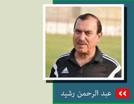
جفاف نهر الإنجاز العراقي

المراقب العراقي / صفاء الخفاجي استطاع المنتخب الوطني بكرة القدم العودة من، أبو ظبي» وشيعتيا القرن الماضي بما جرى لها بعد عام ٢٠٠٣، نجد فجوة هائلة لا يمكن تجاهلها. برغم الظروف الاقتصادية الصعبة، خاصة في فترة التسعينيات، كان العراق يحقق إنجازات رياضية مشرفة. أما بعد عام ٢٠٠٣، وبرغم الوفرة المالية غير المسبوقة التي وضعت في خزان الرياضة، فإن الإنجازات تكدت أكثر من معدومة، والرياضات التي شهدت نجاحات محدودة، لا تكتفي كتعويض الفراغ الكبير. السؤال الأهم: ما سبب هذا التراجع، هل هو غياب الحساسية، أم نقص الضمائر التي تخاف الله، أم ضعف الآليات العلمية والعملية لتطوير الأبطال. أم عدم قدرة المسؤولين على قيادة الرياضة؟ كل هذه الأسئلة تظل بلا إجابة واضحة، بينما تستمر السنوات العجاف على مدار أكثر من ٢٢ عامًا، رغم الدعم الحكومي المالي والمعنوي.