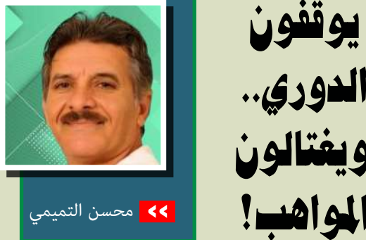
يوقفون الدوري.. ويقتلون المواهب!