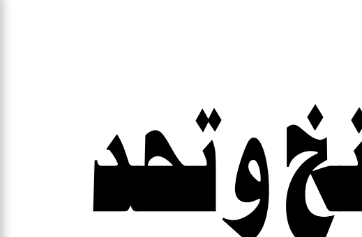
يوقفون الدوري.. ويقتلون المواهب!

قرار اتحاد كرة القدم إيقاف دوري نجوم العراق لمدة ٢١ يومًا من أجل إعداد فريقنا الوطني لمباريات الملحق مع منتخب الإمارات، فيه الكثير من الظلم والإجحاف بحق اللاعبين الآخرين الذين يُفترض أن يحصلوا على فرصتهم بغياب لاعبي المنتخب الوطني، واكتشاف مواهب جديدة كانت منشرة على ركة الدول. يمكن أن تكون المباريات التي سيلعبونها مع فريقهم انطلاقاً مهمة لجيل جديد من اللاعبين، بدلاً من طردهم ونسيانهم، حالهم حال الكثير من اللاعبين الذين لم يحصلوا ولو على خمس دقائق لاثبات وجودهم مع فريقهم، وهي طامة كبرى تعاني منها كرة القدم العراقية منذ زمن بعيد جداً. الأغلبية من مدربي فرقنا المحلية يتعجبون جداً ويبدون رفرهم وتعترضهم عندما تحدثهم عن منح الفرصة للاعبين الشباب، وعدم زجهم بشكل أساسي في التشكيلة، وهم يتخججون بأن اللاعب الشاب لا يستطيع المقاومة والبطالة وتكونه البياقة البدنية، وهو بذلك يُبين ذاته، لأنه السبب الرئيس فيتعطلخلفنا.