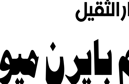
يوقفون الدوري.. ويقتلون المواهب!

أثبتت مباريات الدوريات الأوروبية ودوري الأبطال أن كرة القدم العالمية أصبحت تعتمد على اللاعبين الصغار في السن، مثلما يُرزح بهم أغلب فرق الدوريات الأوروبية، وفي مقدماتهم مانشستر سيتي وباريس سان جيرمان وبرشلونة وليفربول، وقرى أخرى اعتمدت على لاعبي شباب تراوح أعمارهم ما بين ١٨ و ٢٠ عاماً، هؤلاء أثبتوا مهاراتهم وخسب تعزمهم، لأن المرزئين الذين يشرفون على تدريبهم يتعمدون بقوة الشخصية والشجاعة، وعدم التصايع لطلبات إدارات الأندية، بل برفضها جملة وتفصيلاً، ويتمشكون بقعاتهم البدنية على القوة والتجربة والتفكير الصحيح». في السابق كان اتحاد كرة القدم العراقي يفرض رأيه، ويُجزر جميع اللاعبين على ضرورة تأهيل خمسة لاعبين من فرق الشباب إلى الفريق الأول، حتى صارت لدينا قاعدة كبيرة وواسعة من اللاعبين، ولم يكن لدينا نظام الاحتراف في حينها، لأن اللاعبين الصغار عندما يتمنون مع معاملة اللعبة يترادون خبرة وتجربة وثقة بالنفس، وفي حال زجهم في مباريات الدوري المحلي يشعرون وجدهم، والأغلبية من نجومنا الشبان تخرجوا من فرق الشباب وأصبحوا فيما بعد من الكوادر المهمة في المنتخبات الوطنية، لأنهم تخرجوا خطوة بخطوة بالشكل الصحيح من الشباب إلى الناشئين إلى الشباب (يعني يلعبون مثلما يقول الليطاني).