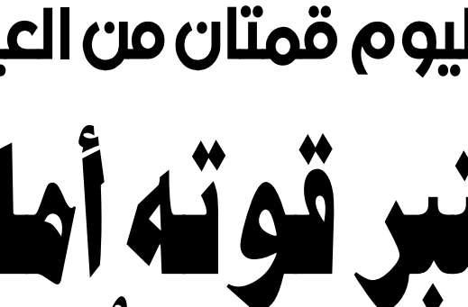
يوقفون الدوري.. ويقتلون المواهب!

ويعود تشابي أونسو مدرب ريال مدريد، إلى ملعب أنفيلد لمواجهة فريقه السابق ليفربول، بعد بداية شبه مثالية لمسيرته مع «الكلبي» الإنجليزي، يعاني ليفربول من تراجع في المستوى، إذ لم يحقق سوى انتصارين في آخر عامي مبارياتات، بينما يعيش «البريتش» تحت قيادة أنونسو فترة مزدهرة. وجاءت هزيمته لفترة مزدهرة، والعاصمة أمام ألتيتكو مدريد. ويعد أن باقي موسما إضافيا مع باير ليفركوزن إثر إقامته إلى لقب الدوري الألماني، تولى أونسو تدريب ريال مدريد خلفاً لليفال كارلو أنشيلوتي، بعد موسم خال من الألقاب الكبرى. ١٤ مباراة هذا الموسم. قال أونسو: «لقدون بالألقاب، عليك أن تدافع جيداً وتحافظ على نظافتك شبابك»، وذلك بعد أن حقق هذا الأمر للمرة السابعة هذا الموسم في الفوز على فالنسيا ٤ - ٠. ويعول أونسو على هدفه الملتاق الفرنسي كيليان مبابي صاحب ١٨ هدفاً هذا الموسم، فيما استعاد الإنكليزي جود بيلينجهام بريته. في المقابل، فاز ليفربول على أسون فيلا ٢ - ٠، ليضع فريق المدرب الهولندي أرنس، سلوت حدا لسلسلة هجيبة من ٤ هزائم متتالية في الريميرليج، فبعد إلى المركز الثالث.