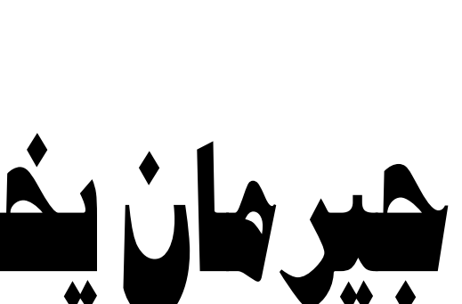
يوقفون الدوري.. ويقتلون المواهب!

وقد انطلق الموسم الماضي، نجح سان جيرمان أخيراً في تحقيق حلمه القاري، وبلغ قمة مستواه في الوقت المناسب. ورغم أن صدارة سان جيرمان للدوري الفرنسي لم تكن معبدة بالوهود هذا الموسم، إذ يتعدى بنفطهم فقط عن مارسيليا ولانس، إلا أنه احتفظ بأفضل عروضه للمنافسة الأوروبية. ريال بصيغة الأونسو ويعود تشابي أونسو مدرب ريال مدريد، إلى ملعب أنفيلد لمواجهة فريقه السابق ليفربول، بعد بداية شبه مثالية لمسيرته مع «الكلبي» الإنجليزي، يعاني ليفربول من تراجع في المستوى، إذ لم يحقق سوى انتصارين في آخر عامي مبارياتات، بينما يعيش «البريتش» تحت قيادة أنونسو فترة مزدهرة. وجاءت هزيمته لفترة مزدهرة، والعاصمة أمام ألتيتكو مدريد. ويعد أن باقي موسما إضافيا مع باير ليفركوزن إثر إقامته إلى لقب الدوري الألماني، تولى أونسو تدريب ريال مدريد خلفاً لليفال كارلو أنشيلوتي، بعد موسم خال من الألقاب الكبرى. ١٤ مباراة هذا الموسم. قال أونسو: «لقدون بالألقاب، عليك أن تدافع جيداً وتحافظ على نظافتك شبابك»، وذلك بعد أن حقق هذا الأمر للمرة السابعة هذا الموسم في الفوز على فالنسيا ٤ - ٠. ويعول أونسو على هدفه الملتاق الفرنسي كيليان مبابي صاحب ١٨ هدفاً هذا الموسم، فيما استعاد الإنكليزي جود بيلينجهام بريته. في المقابل، فاز ليفربول على أسون فيلا ٢ - ٠، ليضع فريق المدرب الهولندي أرنس، سلوت حدا لسلسلة هجيبة من ٤ هزائم متتالية في الريميرليج، فبعد إلى المركز الثالث.