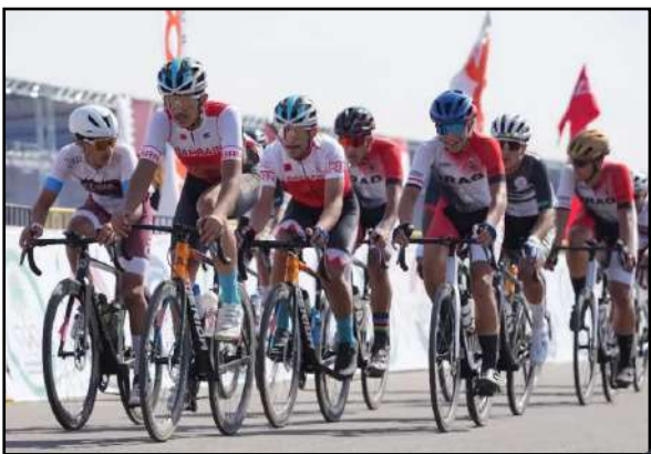
المراقب العراقي / بغداد بدأ منتخب الناشئين للدراجات معسكره التدريبي في العاصمة بغداد، حيث انضمت مشاركة في بطولة العرب التي أقيمت في السلبيانية وذلك تحضيراً للمشاركة في دورة الألعاب الآسيوية التي تستضيفها البحرين.

لهذه الأسباب المتراكمة والمستنفة، ويدون أي إحباط بوجهة النظر هذه، أرى أن السيناريو لن يكون مغائراً لما سبق، والتنتائج لن يحد فيها جديد لا في الدور الثاني ولا الثالث، والدراجات الخمسة الكفيلة بالنجاح كفرضة أخيرة.