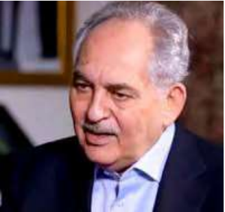
بقلم: سمير الحباشنة

مع كل إعلان عن قمة عربية، يتجدد فينا الأمل لأن نرى نتائج هذه القمة وقد تحققت على أرض الواقع، بحيث ينتقل العرب بعلاقاتهم من حال إلى حال أرقى، من حيث التنسيق والتعاون، وبالذات في المجالات التنموية والاستثمارية والاقتصادية، لأن تلك المجالات هي التي ترفع من شأن أقطارنا واقتصاداتنا، وترفع من سوية مواطنينا. وهي فرصة مؤاتية لأن نفعل اتفاقات السوق العربية المشتركة، التي هي عملياً من حيث العمر أقدم من السوق الأوروبية المشتركة.