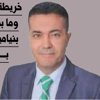
بقلم: د. بسام روبين

وما بدا للعلن كخلاف بين الرئيس الأمريكي دونالد ترامب ورئيس الوزراء الإسرائيلي بنيامين نتتياهو، لم يكن في حقيقته إلا تنسيقاً استراتيجياً لتحقيق أهداف متشابهة، بدأت بتقويض أي فرصة لحل عادل للقضية الفلسطينية، ومروراً بدفع أنظمة عربية نحو التطبيع، وصولاً إلى استنزاف ثروات الشعوب العربية وإبقائها في دائرة الفقر.