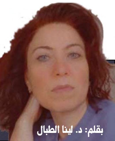
بقلم: د. لينا الطلال

هل سبق أن وقفتم أمام لوحة كوارث الحروب «Los Desastres de la Guerra» لفرانيسكو غويا؟ هي سلسلة من اثنين وثمانين نقشاً فنياً، لا مكان فيها للرحمة، تروي ويلات الحروب والمجاعة والموت، تخط العنف والتعذيب، وتقطيع الأشلء والقتل، هنا جثث بلا هوية بلا رؤوس أو أطراف، تعذيب بلا ميرر، ودماء سائلة كأمطار غزيرة، في كل زاوية تمزيق لأجساد واشلاء تتناثر، الكثير من الأشلاء، في تلك التحفة الفنية، لا يوجد أي أمل، فقط رعب، وحشية وتجرد من الإنسانية.