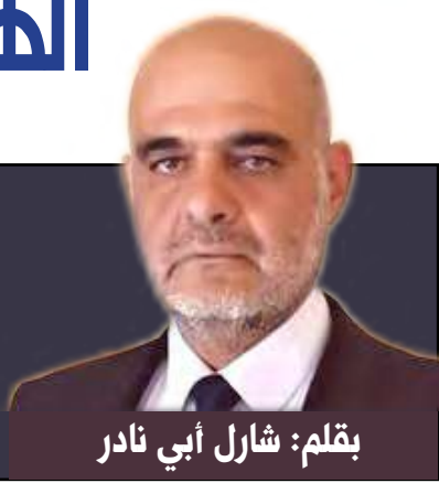
بقلم: شارل أبي نادر

تعددت الأسباب التي أسست للصراع التاريخي «الهندي- الباكستاني» حيال كشمير، من خلافات على ملكية مناطق جغرافية إلى خلافات قومية إلى أثنية إلى دينية، لتصبح بعد مدة على خلفية اتهامات متبادلة عن تدخلات وتغطيات لظواهر تمرد وعصيان ورعاية أعمال إرهابية، وإذ يمكن لأي من هذه الأسباب، أو بعضها أن تشكل دافعاً منتجاً لما حصل مؤخرًا من مواجهات عسكرية دائمية بين الدولتين، يبقى البعد الاستراتيجي هو الأساس في هذه المواجهة، والتي كان، أيضًا للموقف الدولي، وخاصة الأمريكي، دور أساسي في ضبطها، حتى الآن؛ مع عدم استبعاد تجدها وتوسعها.