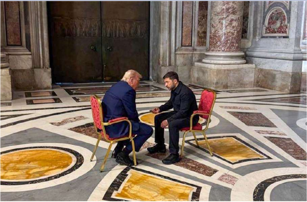
بقلم: اسيا العتروس

خمس عشرة دقيقة هي المدة التي استغرقها لقاء الرئيس الأمريكي دونالد ترامب مع الرئيس الاوكراني زيلنسكي على هامش جنازة بابا الفاتيكان، وبدا من الواضح أنه أريد لهذا اللقاء الذي يمكن وضعه في إطار دبلوماسية الجناز، ألا يكون خلف الكواليس بل يكون تحت أنظار الجميع في كاتدرائية القديس بطرس وفيما كان قادة العالم يتوافدون لوداع الحبر الأعظم ..