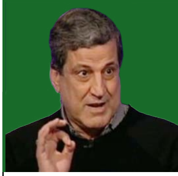
بقلم: نجاح محمد علي