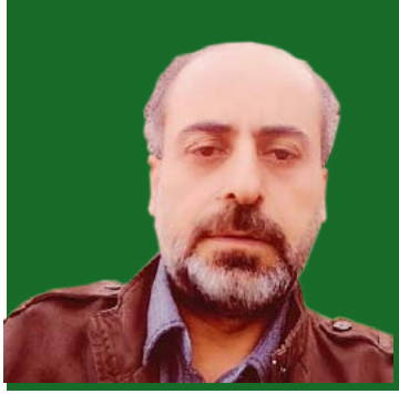
بقلم: جو غانم