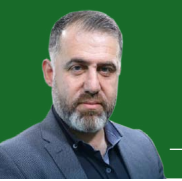
بقلم: وسام إسماعيل

قال إيليا أبو ماضي:- أيسري النعش أي فتى يُوري وهذا القبر أي فتى يصون؟ فتى جُمعت ضروبُ الحُسن فيه وكانت فيه للحُسن فُنونٌ هذا الثلج بكاءً أبيض، لكنّه رغم كل تلك الغزارة، لا يتجمّع على سفوح الروح، ثمّة ما يُذيبه قبل أن يستقرّ، ثمّة حرارة غريبة تحيل كل هذا الصقيع إلى نهر من البياض الجارف الذي يأخذ معه كل شيء باتجاه واحد، باتجاه نعش تستقرّ فيه أمة تامّة الأركان والبهاء، نعش تحمله أمة كاملة الذم. هل يُعقل هذا؟ هل يحدث فعلاً أن يُشيع المرء نفسه؟ أن يحمل الإنسان جسده على كتفه ويمضي به إلى مؤتى آخر أو أخير؟ أن يسير خلف نعشه ويندب نفسه مع النادين؟ هل هذه إحدى عجائبك الكثيرة يا سيّد الحُسن؟ هل أنت نحن، كلنا؟ وهل تلك جنازتنا حقاً، أم إنه الوعد بقيامتنا