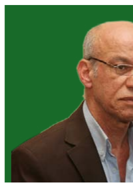
بقلم / د. محمد أبو بكر

تجاوزت التحركات المشبوهة حدود إقامة الاعتصامات في وسط الساحة