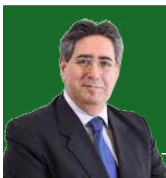
بقلم / روني ألفا

الكتاب عن فلسطين لا تنتهي، وهل هناك ما يستحق أن نكتب عنه غير هذه الأرض الطاهرة، المشبعة برجال نذروا أنفسهم في سبيلها، رجال ما زالوا يدافعون عن أمة بأكملها، استساعت حتى اليوم الصمت المخجل، وهي تشهد كل يوم ما يجري في غزة المقدسة. شعبي الفلسطيني يستحق الحياة،