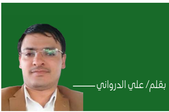
بقلم / علي الدرواني